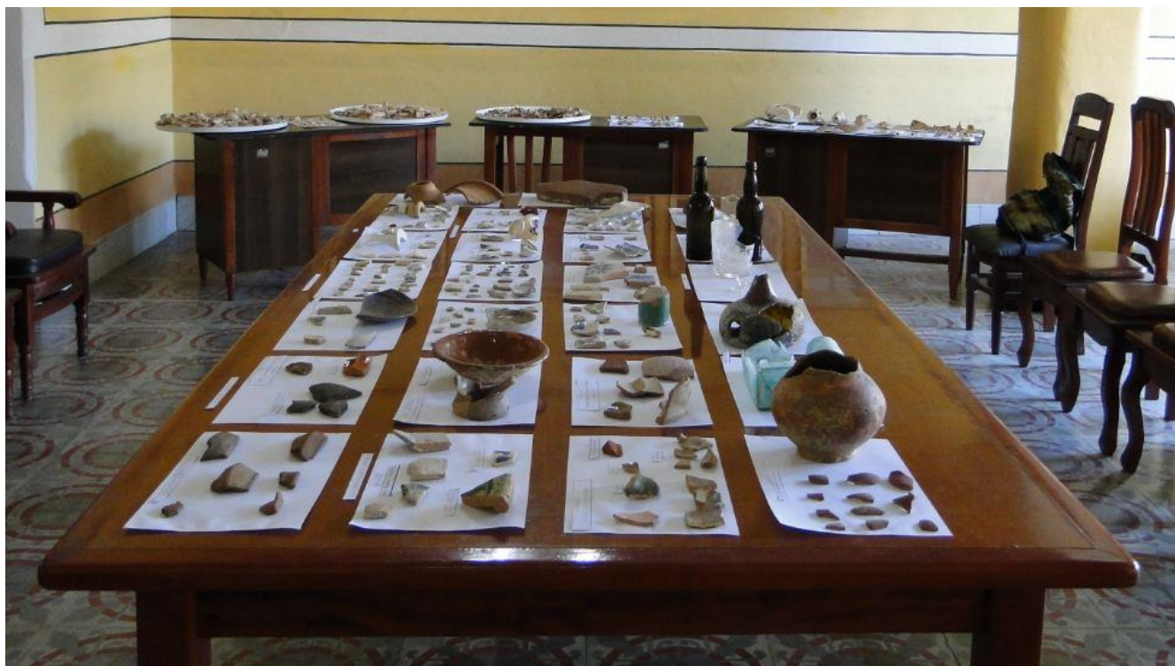
FIG. 5. Mesas interactivas. Salón de Reuniones de la Oficina de Monumentos y Sitios Históricos del CPPC, en Sancti Spíritus

solución a la problemática que se presenta en Sancti Spíritus”.