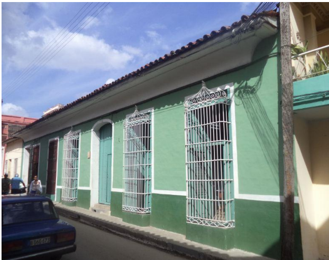
FIG. 1. Oficina de Monumentos y Sitios Históricos del CPPC, en Sancti Spíritus

El trascendental suceso, tuvo lugar el día 8 de febrero en la Oficina de Monumentos y Sitios Históricos del Centro Provincial de Patrimonio Cultural (CPPC) de Sancti Spíritus, donde radicará su sede temporal, como parte del Programa de Actividades del Curso de Adiestramiento en Técnicas de Excavación Arqueológica, Tipología de Materiales Cerámicos y Estudio de la Dieta, que se desarrolló entre el 8 y el 11 de febrero del año en curso (fig. 1).