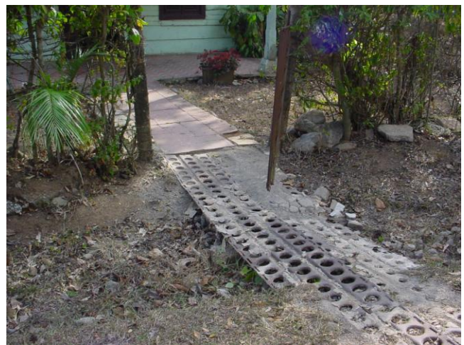
FIG. 4. Reutilización de material de la base, Santa Cruz de los Pinos

blación local y que este trabajo, junto con los restos materiales, pueden crear procesos de memorias (Burström et al. 2006, 2009, 2011; Burström y Karlsson 2008). Uno de los resultados indirectos de esta fase del proyecto fue también que el antiguo sitio de misiles en Santa Cruz de los Pinos comenzó a ser reconocido al nivel local como un recurso de interés histórico por la dirección local del patrimonio cultural. Como consecuencia, el museo local en San Cristóbal fue renovado y reabierto en 2008 con la historia del sitio de misiles como una parte importante de la exposición. Esto nos lleva directamente a la segunda fase del proyecto.