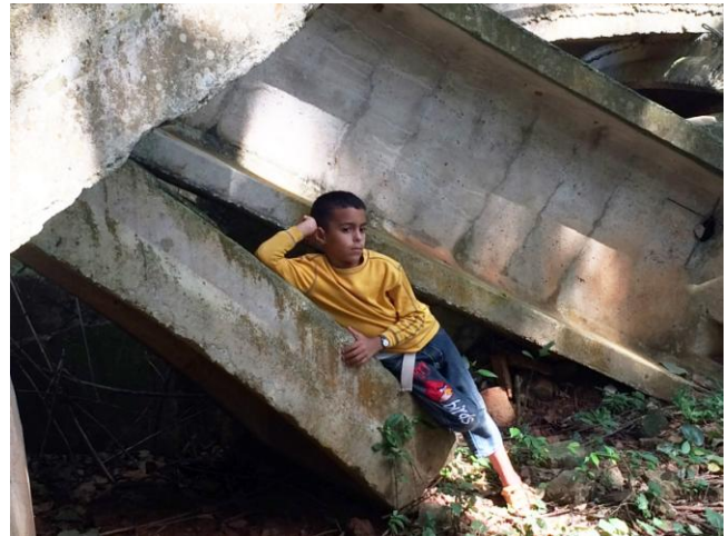
FIG. 7. Desde el VI taller científico y la visita del sitio

rial sobre el sitio; un ejemplo constituyen las fotografías que muestran cubanos como turistas en la base abandonada en 1963.