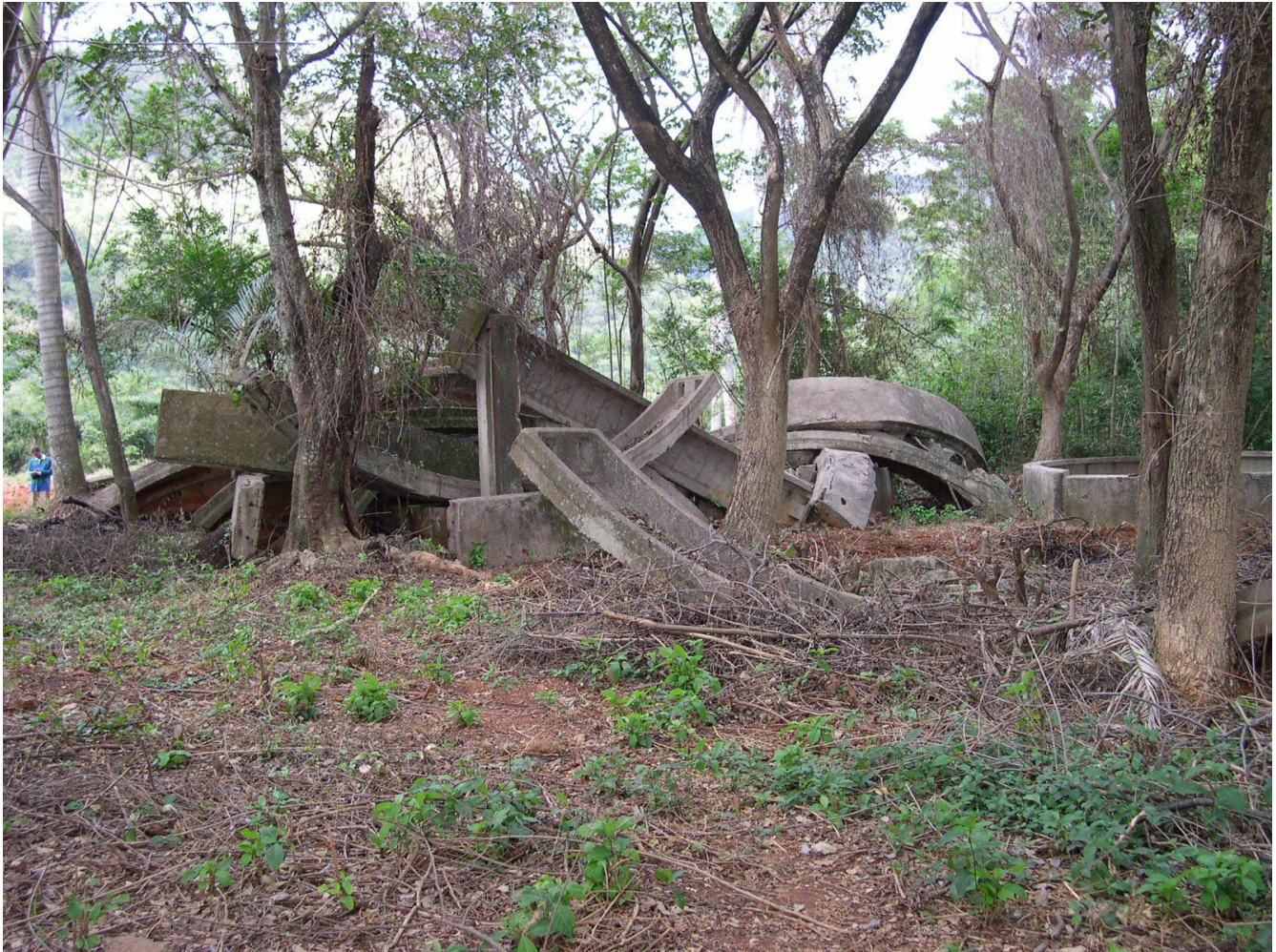
FIG. 2. Restos del hangar (para los misiles nucleares) in situ en Santa Cruz de los Pinos