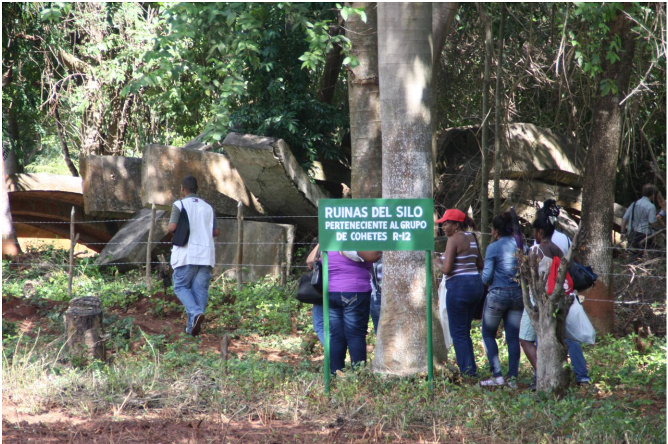
FIG. 6. Signo de la información en el sitio

en el patrimonio cultural sombrío ( dark heritage ). Es un campo que incluye a las distintas formas de patrimonio cultural que están pobremente comprendidas, poco comunicadas y descuidadas por la investigación, ya que contiene los recuerdos que las sociedades y los seres humanos quieren olvidar, ya que son restos dolorosos, recordatorios sobre lo oscuro de la naturaleza humana, por ejemplo, los campos de concentración, los restos militares, el colonialismo y la esclavitud (por ejemplo, Buchli y Lucas 2001; Schofield y Croft eds. 2007; Cox y Bell 1999; Doretti y Fondebrider 2001; Hall 2000; Wilkie 2001; Carman ed. 1997; Dobinson 2001; Saunders ed. 2004; Burström, Gustafsson y Karlsson 2008, 2011; Holtorf y Piccini eds. 2009). El proyecto es también una parte del cada vez mayor campo temático de la utilización contemporánea de la historia y la relación entre el patrimonio cultural y la sociedad. En recientes décadas este campo de investigación ha generado extensas investigaciones, a nivel nacional e internacional, en las disciplinas historia y arqueología, así como en la investiga-