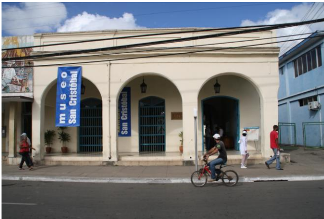
FIG. 5. El edificio del museo en San Cristóbal

hay un debate considerable acerca de cómo este tipo de participación puede ser utilizado como una fuerza en la dirección de un desarrollo sostenible al nivel local (por ejemplo, Saltzman y Stenseke eds. 2004; Gastil y Levine eds. 2005). Este desarrollo ha cambiado en parte el foco de la segunda fase del proyecto, a preguntas sobre aspectos vinculados al patrimonio cultural, su reutilización y su relación con los actores locales y el desarrollo sostenible local. A nivel general, el objetivo es analizar la participación histórica local (museo y las partes interesadas) con el sitio en Santa Cruz de los Pinos y de los enfoques y usos de este patrimonio cultural. El propósito es también fortalecer las investigaciones cubanas sobre la participación local en el patrimonio cultural y conectarlo a discursos internacionales sobre este tema. En este contexto, la situación sueca es valiosa como una comparación debido a la tradición anticuaria en la sociedad sueca. Esto puede concretarse en una serie de preguntas temáticas generales que el proyecto quiere analizar: