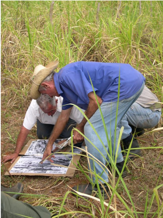
FIG. 3. Recuerdo en Santa Cruz de los Pinos

llevándose a cabo un trabajo más profundo en la última de estas bases.