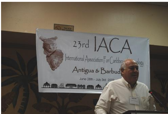
FIG. 3. Durante la exposición de su ponencia en el Congreso de la IACA, en Antigua y Barbuda (2009).