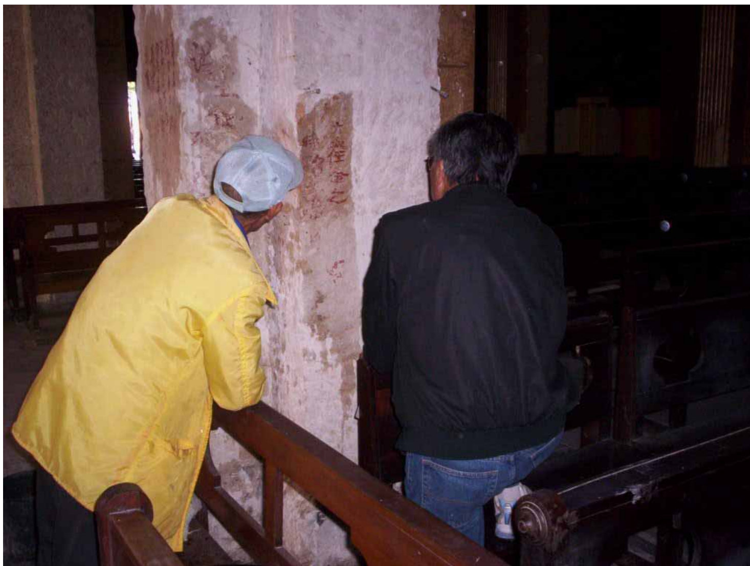
FIGURA 2. Ciudadanos de origen chino que colaboran en la identificación de los textos

ha sido retirado el estuco dejándose los ladrillos al desnudo. Ello ha sido la causa del descubrimiento de pinturas parietales, las cuales están constituidas por cortos textos en caracteres chinos elaborados con un pigmento rojo oscuro. Un grupo de especialistas del Departamento de Investigaciones Históricas y Aplicadas a la Arquitectura, perteneciente a la Oficina del Conservador de la Ciudad, realizó los estudios preliminares de estos hallazgos, cuyos resultados han sido recogidos en un breve informe en el cual leemos: “En el mes de enero del 2009, mientras se desarrollaba la restauración del ala derecha de la Catedral, en la entrada sur, entre los ejes arquitectónicos (A-5) y (B-6), al retirar el repello de yeso existente en las paredes y columnas se hallaron sobre los ladrillos y los