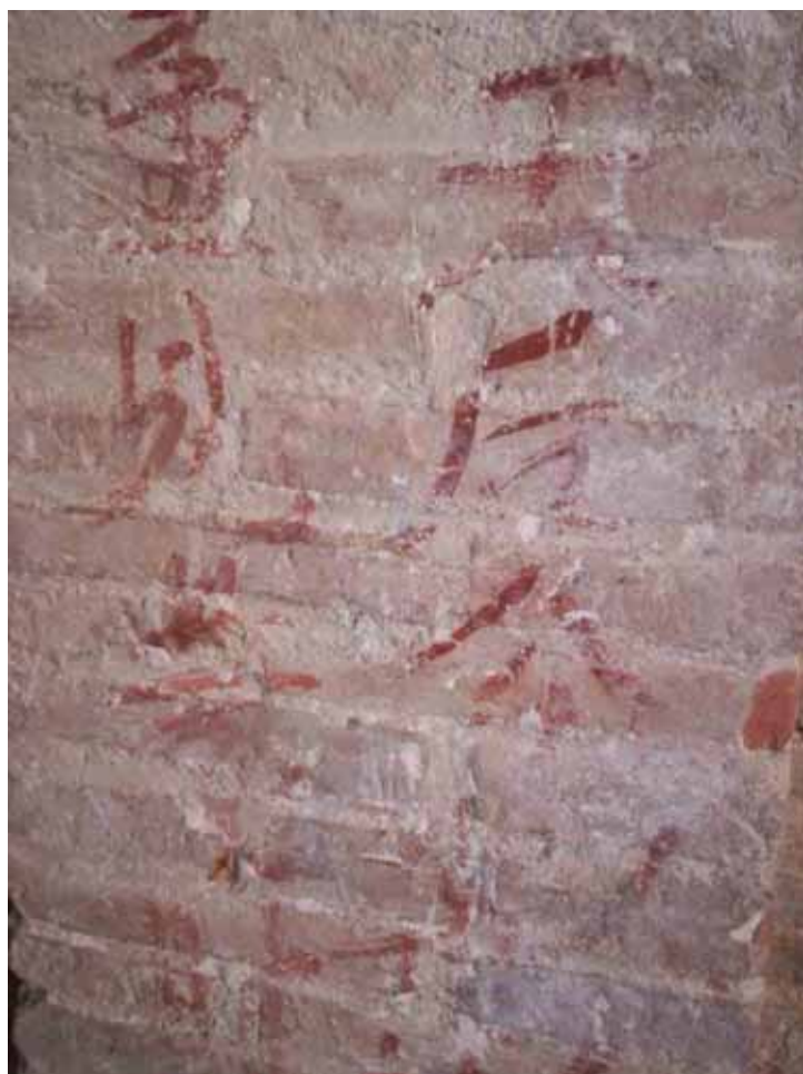
FIGURA 4. Vista de los ideogramas chinos sobre los muros de ladrillo

Este descubrimiento resulta novedoso por cuanto hasta ahora se desconocía de manera documentada la participación de trabajadores chinos en la construcción del templo. Ello ha abierto nuevas fuentes de información a historiadores y arqueólogos, quienes son apoyados por estudiantes chinos de la Universidad Carlos Rafael Rodríguez de Cienfuegos y ciudadanos de origen chino residentes aquí, los que colaboran con los investigadores en la interpretación de los textos. Es de destacar que uno de los textos constituye un llamado a mantener el orden y la limpieza en el lugar, mientras que otros son como reclamos a los dioses para la protección y buena fortuna de los trabajadores y de la obra que construían.