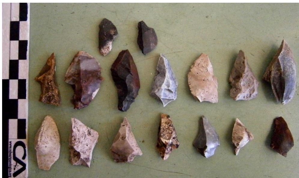
FIG. 2. Puntas líticas talladas en sílex.