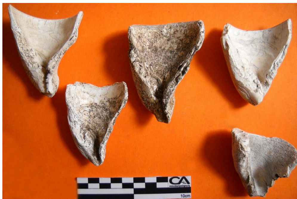
FIG. 3. Gubias de concha recuperadas en superficie.

guos ocupantes de Jigüe 1. Hacia el sector Norte del yacimiento se recuperaron de forma aislada 13 fragmentos de huesos largos humanos, entre ellos uno de fémur, así como dos piezas dentales de adultos consistentes en un molar y un premolar, los cuales exponen marcado desgaste. Ninguno de los restos óseos permite por el momento establecer filiación racial, debido a la ausencia de elementos diagnósticos como dientes incisivos en pala, huesos largos completos, malares, etc. Diversas evidencias preparadas en conchas marinas, como maceradores, gubias, raspadores y puntas