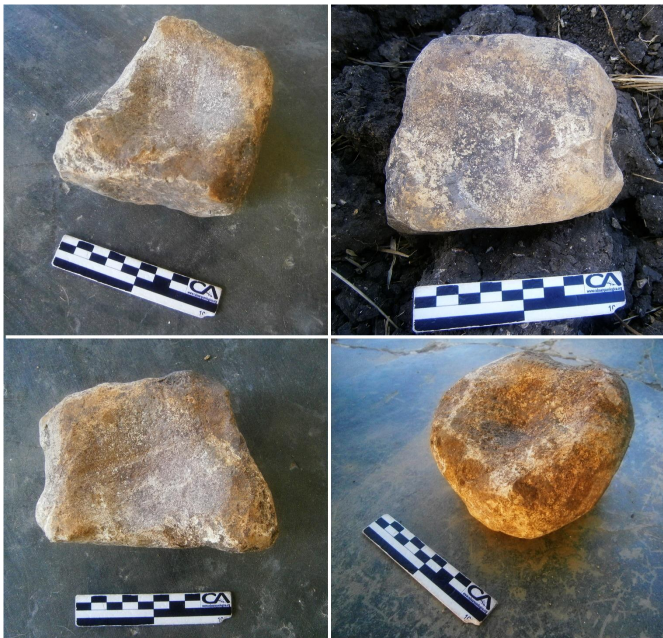
FIG. 4. Conjunto de lajas molderas en rocas calizas.

fragmentos de cráneo humano fueron obtenidos, sin que se haya podido establecer ninguna relación anatómica entre las partes. El monto de puntas de lanzas y de flechas contabilizado indica la recurrencia de actividades económicas vinculadas a la pesca ribereña, caza de aves y mamíferos.