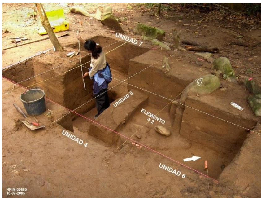
FIG. 5. Bateyes de Viví. Bloque A. Midiendo la pared de la Unidad 7. La excavación muestra (arriba derecha) la hilera oriental del batey erecto tras la última inundación. El elemento 4-2 muestra los monolitos del primer batey (pre-inundación) que fueron ritualmente enterrados y su orificio tapado por otro monolito (con un petroglifo).

esta localización. Sin embargo, y contrario a lo ocurrido en Tibes, el sitio regresó a ser ocupado en su totalidad, reconstruyendo y rehabilitando el área, y continuando sus procesos sociales. Tanto Tibes como Viví presentan estructuras megalíticas ceremoniales. Oliver (2009) ha argumentado que los petroglifos de los bateyes tienen cemí, o potencia vital, la cual está sustentada por el terreno o el espacio donde eran erigidos. La cercanía a ríos, lo cual es un factor recurrente en centros ceremoniales, sugiere que el agua es un componente esencial en las ceremonias rituales. Por lo tanto, aun cuando el colocar el sitio en un llano aluvial y adyacente