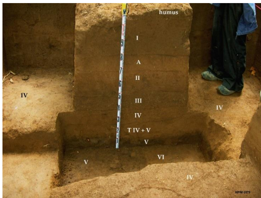
FIG. 4. Bateyes de Viví. Estratigrafía de la Unidad 7. Los estratos III (segunda inundación) y T-IV y V (primera inundación, pre-ocupación) que muestran los dos depósitos de sedimentos inundación aluvial violenta acaecidas en Bateyes de Viví. El estrato VI (banda oscura) es un paleosuelo. Foto J.R. Oliver 2005