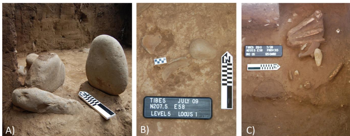
FIG. 2. Unidad OP-19. (a) Peñas depositadas en posición lateral o de perfil, evidenciando desplazamiento por el evento de la inundación. (b) Fragmentos de cerámica en capa estéril asociados a la inundación. (c) Huesos humanos articulados en capa de sedimento asociada a la inundación.

milares ocurrieran nuevamente, Tibes no fue abandonado.